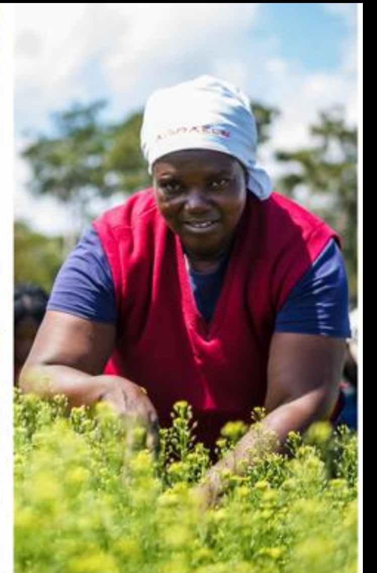
Agricoltori, fase di semina e raccolta del ricino, Congo